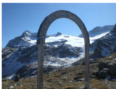
Passo di Campagneda