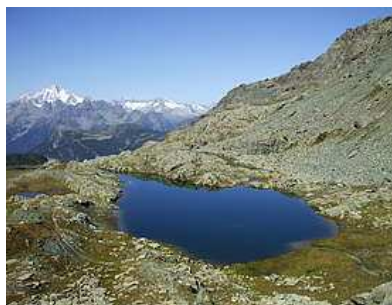
Laghetti di Campagneda