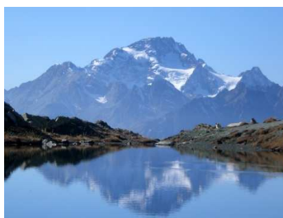
Monte Disgrazia dai Laghetti di Campagneda