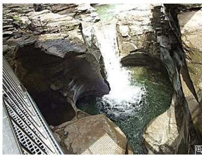
Marmitte dei Giganti (Cavaglia)