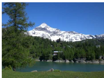
Pizzo Scalino e Rifugio Zoia