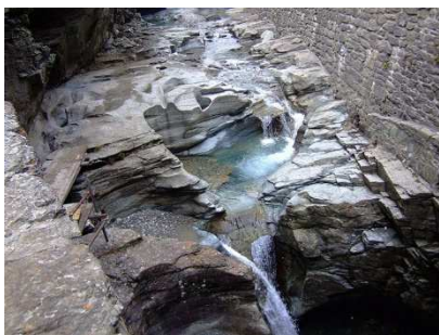
Marmitte dei Giganti (Cavaglia)