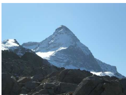
Pizzo Scalino dal Passo di Campagneda