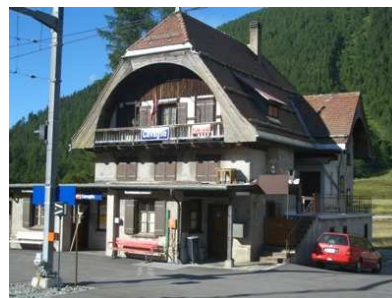
Stazione di Cavaglia