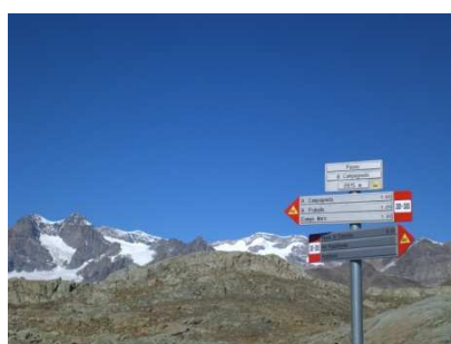
Passo di Campagneda